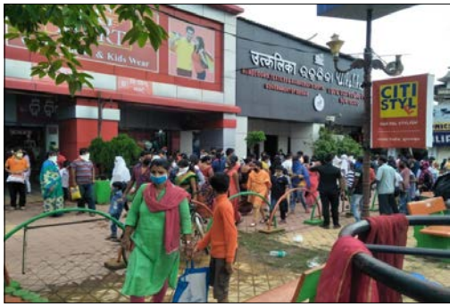
ଦୋକାନୀମାନଙ୍କୁ ବିଏମ୍‌ସି ପକ୍ଷରୁ ଉଠାଇ ଦିଆଯାଇଥିଲା । ମାର୍କେଟ୍ ବିଲ୍ଡିଂରେ ଥିବା ସ୍ତ୍ରୀୟା ଦୋକାନୀମାନେ ଅଭିଯୋଗ କରିଥିଲେ ଯେ ଉଠା ଦୋକାନୀଙ୍କ ପାଇଁ ସେମାନଙ୍କ ବ୍ୟବସାୟରେ କ୍ଷତି ପହଞ୍ଚିଛି । ତେବେ କିଛିଦିନ ପରେ ଉଠା ଦୋକାନୀମାନେ ପୁଣିଥରେ ଆସୁ ଜମାଜମାକୁ ଉଦ୍ଧେଷ୍ଟ ମଧ୍ୟରେ ବିବାଦ ସୂଚି ହୋଇ ହାତହାତି ପର୍ଯ୍ୟନ୍ତ କଥା ଯାଇଥିଲା ।

ଭୁବନେଶ୍ୱର (ଭାସ୍କର ନ୍ୟୁଜ୍) : ରାଜଧାନୀ ଭୁବନେଶ୍ୱରର କାରବାର ପେଣ୍ଡୁଳୁ ଭାବେ କୁହାଯାଉଥିବା ମାର୍କେଟ୍ ବିଲ୍ଡିଂ ଅନିର୍ଦ୍ଦିଷ୍ଟ କାଳ ପାଇଁ ବନ୍ଦ ରଖାଯାଇଛି । ରବିବାର ସ୍ତ୍ରୀୟା ଓ ଅସ୍ତ୍ରୀୟା ଦୋକାନୀଙ୍କ ମଧ୍ୟରେ ଗଣତାନ୍ତ୍ରିକ ପଦକ୍ଷେପ ଗ୍ରହଣ କରି ନିଷ୍ପତ୍ତି ନେବାକୁ ବାଧ୍ୟ ହୋଇଛି । ସୁଦୀର୍ଘ ୧୫ ମାର୍କେଟ୍ ବିଲ୍ଡିଂ ଅଞ୍ଚଳ ରାଷ୍ଟ୍ରପାଞ୍ଚରେ ବସୁଥିବା ଦୋକାନୀମାନେ ବଳପୂର୍ବକ ମାର୍କେଟ୍ ବିଲ୍ଡିଂ ପରିସରକୁ ପ୍ରବେଶ କରି ସେଠାରେ ସେମାନଙ୍କ ଖଲ୍ଲ ବ୍ୟବସାୟରେ ଯାହାକୁ ଚେତେଇ ଯୁକ୍ତିଯୁକ୍ତ ଆବେଦନସହ ସର୍ବସମ୍ମତରେ ତାହା ବିରୋଧ କରିଥିଲେ । ଏପରିକି ଚେତେଇ ଯୁକ୍ତିଯୁକ୍ତ ଆବେଦନସହ ସର୍ବସମ୍ମତରେ ଅଭିଯୋଗ କରିଛନ୍ତି କି ରାଷ୍ଟ୍ର ପାଞ୍ଚ ଦୋକାନୀମାନେ ତାଙ୍କୁ ଆକ୍ରମଣ କରିବାକୁ ପକାଇନଥିଲେ । ପରେ ସେମାନେ କ୍ୟାପିଟାଲ ହସ୍ତିକାଳରେ ଖବର ଦେବା ପରେ ପୋଲିସ୍ ପହଞ୍ଚିଥିଲା । ସୁଦୀର୍ଘ ୧୫ ଦିନ ଧରି କିଛିଦିନ ତଳେ ବିଏମ୍‌ସି ମଧ୍ୟ ମାର୍କେଟ୍ ବିଲ୍ଡିଂ ଅଞ୍ଚଳରେ ଅତିଥି ଦୋକାନୀଙ୍କୁ ଉଦ୍ଧେଷ୍ଟ କରିବା ନେଇ ସୂଚନା ଜାରି କରିଥିଲା । ଏପରିକି ପ୍ରାୟ ସମୟରେ ଏଠାରେ ଗ୍ରାହକ ସମସ୍ୟା ଦେଖାଦେଇଥିଲା । ଗତ କିଛିଦିନ ତଳେ ଉଭୟପକ୍ଷ ମଧ୍ୟରେ ବିବାଦ ଉପସ୍ଥିତରୁ ଉଠି