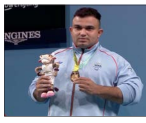
ଆଥଲେଟ୍ ଏହି ଇଭେଣ୍ଟର ଅନ୍ୟ ମ୍ୟାଚରେ ପରାଜୟ ସ୍ୱୀକାର କରିଛନ୍ତି ।

ପଦକ ଭାରତ ପାଇଁ ରାଜ୍ୟଗୋଷ୍ଠୀ କ୍ରୀଡାରେ ପଦକ ହାସଲ ନିଶ୍ଚିତ କରିଛନ୍ତି । ପାରା ଷ୍ଟେଟିସ୍ମାନ ସୁଧୀର ମହିଳା ସିଙ୍ଗଲ୍ ସେମିଫାଇନାଲରେ ଭାବିନା ପଦକ ଲାଭ କରିଥିବା ସୁଧୀର ବେଲ୍‌ସ୍ମେଲ୍ ୧୧-୬, ୧୧-୬, ୧୧-୬ରେ ପରାସ୍ତ କରି ଫାଇନାଲରେ ପ୍ରବେଶ କରିଛନ୍ତି । ତେବେ ଭାରତର ଅନ୍ୟ ସମସ୍ତ ପାରା