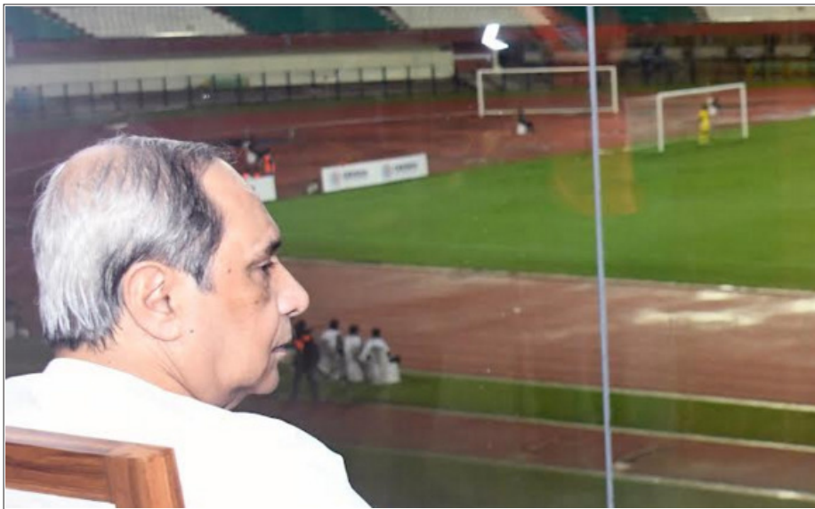
ସାଫ୍ ଫୁଟବଲ୍ ମ୍ୟାଚ୍‌ରୁ ଉପଭୋଗ କରୁଛନ୍ତି ମୁଖ୍ୟମନ୍ତ୍ରୀ ନବୀନ ପଟ୍ଟନାୟକ

ତେବେ ଭାରତ ପକ୍ଷରୁ ଲଗାତର ଆଠାକିଶ ଖେଳ ଦେଖିବାକୁ ମିଳିଥିଲା ଏବଂ ଏକତ୍ର ଚାଳନରେ ଭାରତ ୩ଟି ଗୋଲ ଘୋର କରି ୫-୨ରେ ବିଜୟ ହାସଲ କରିଛି । ଚଳିତ ବର୍ଷ ଅନୁଷ୍ଠିତ ଏହି ପ୍ରତିଯୋଗିତାରେ ପୂର୍ବ ହାତେଇବା ସହ ଲଗାତର ଦ୍ୱିତୀୟ ସାଫ୍ ଚାମ୍ପିୟନସିପ ଟ୍ରଫି ଅକ୍ତିଆର କରିଛି । ୨୦୧୯ରେ ସାଫ୍ ଚାମ୍ପିୟନସିପରେ ମଧ୍ୟ ଭାରତ ବାଲାଦେଶକୁ ହରାଇ ଚାମ୍ପିୟନ ହୋଇଥିଲା ।