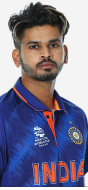
କପରେ ଆୟାର ନିଜର ଦକ୍ଷତା ପ୍ରତିପାଦନ କରିବାକୁ ପଡିବ । ନଚେତ ଆଶାମୀ ଟି-୨୦ ବିଶ୍ୱକପ ଖେଳିବା ତାଙ୍କ ପାଇଁ କଷ୍ଟକର ହୋଇ ପଡିବ ବୋଲି ଚୟନକର୍ତ୍ତା ଅନୁମାନ କରୁଛନ୍ତି ।

କେତେକ ନିର୍ଦ୍ଦିଷ୍ଟ ସଂଖ୍ୟକ ମ୍ୟାଚରେ କୌଣସି ଖେଳାଳିଙ୍କ ଖରାପ ପ୍ରଦର୍ଶନକୁ ନେଇ କୋଚ୍ ପ୍ରାୟତଃ ବିଶେଷ କଠୋର ପଦକ୍ଷେପ ନେଇ ନାହାନ୍ତି । ତେଣୁ ଖରାପ ପ୍ରଦର୍ଶନ ସତ୍ତ୍ୱେ ଆୟାରଙ୍କୁ ଗତ ଅକ୍ଟୋବର ମାସ ମଧ୍ୟରେ ୯ ଟି-୨୦ ମ୍ୟାଚ ଖେଳିବା ସୁଯୋଗ ଦେଇଛନ୍ତି । ତଥାପି ଫର୍ମାକୁ ଫେରି ପାରୁ ନାହାନ୍ତି । ଏହି ୯ ମ୍ୟାଚ ମଧ୍ୟରେ ଆୟାର ଗୋଟିଏ ଅର୍ଦ୍ଧଶତକ ମଧ୍ୟ ହାସଲ କରି ପାରି ନାହାନ୍ତି । ତେଣୁ ଚଳିତ ଷ୍ଟ୍ରେସ୍‌କର୍ଣ୍ଣ ବିପକ୍ଷ ଟି-୨୦ ସିରିଜର ଶେଷ ଦୁଇ ମ୍ୟାଚ ଆୟାରଙ୍କ ପାଇଁ ବିଶେଷ ଗୁରୁତ୍ୱପୂର୍ଣ୍ଣ । ନଚେତ ଆଉ ଅଧ ଦିନ ପରେ ଅନୁଷ୍ଠିତ ହେବାକୁ ଥିବା ଏସିଆ