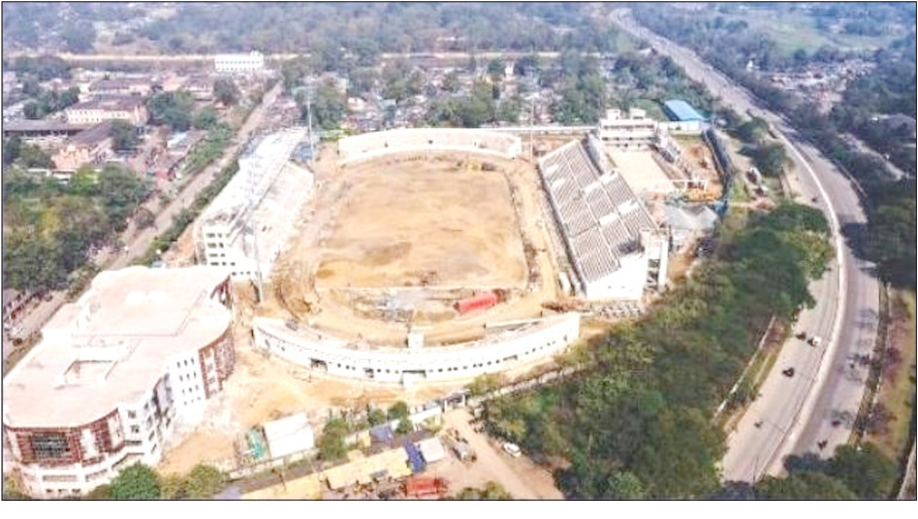
ଆୟୋଜନ କରିବା ପାଇଁ ଏଫ୍ ଆଇଏଚ୍ ଅନୁମୋଦନ ଲାଭ କରିଛି। ତଳିତ ବର୍ଷ ଅକ୍ଟୋବର ୨୮ରୁ ୨୦୨୩ ଜୁଲାଇ ୫ ତାରିଖ ପର୍ଯ୍ୟନ୍ତ

ନୂଆଦିଲ୍ଲୀ: ଅନ୍ତର୍ଜାତୀୟ ହକି ମହାସଭା (ଏଫ୍ ଆଇଏଚ୍) ପକ୍ଷରୁ ମଙ୍ଗଳବାର ଘୋଷିତ ହୋଇଛି ଆସନ୍ତା ସିଜିନ ପ୍ରୋ-ଲିଗ୍ ହକି ପ୍ରତିଯୋଗିତା ପାଇଁ ସମସ୍ତ କେନ୍ଦ୍ର ନାମ ଚାଲିଲା। ସବୁଠାରୁ ଖୁସିର ବିଷୟ ହେଲା ଯେ, ଭୁବନେଶ୍ୱର ପରେ ରାଉରକେଲା ଭାରତର ଦ୍ୱିତୀୟ କେନ୍ଦ୍ର ଭାବେ ପ୍ରୋ-ଲିଗ୍ ପାଇଁ ସୀମା ହୋଇଛି। ସୂଚନା ଯୋଗ୍ୟ ଯେ, ଆସନ୍ତା ବର୍ଷ ଜାନୁଆରୀ ୧୩ରୁ ୨୯ ତାରିଖ ପର୍ଯ୍ୟନ୍ତ ଭୁବନେଶ୍ୱର କଳିଙ୍ଗ ଷ୍ଟାଡ଼ିୟମ ଓ ରାଉରକେଲା ଦର୍ବୀ ପୁଣ୍ଡା ଷ୍ଟାଡ଼ିୟମରେ ପ୍ରଭୁଷ୍ଟ ହକି ବିଶ୍ୱକପ ଅନୁଷ୍ଠିତ ହେବ।