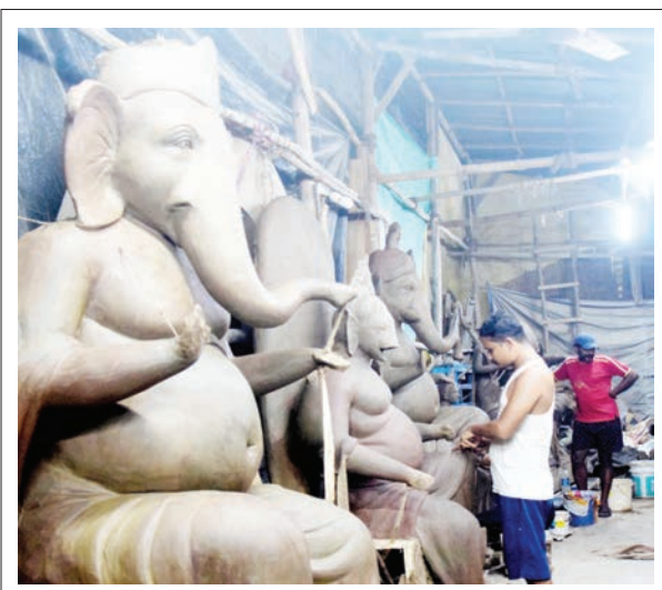
ଗଣେଶ ପୂଜା ପାଇଁ କଟକର ଶିଳ୍ପୀ କୁସାସରାୟ ଚଳଚ୍ଚିତ୍ର

ଯୋଗାଏ । ଏହା ମଧ୍ୟ ଜନେରାଲ୍ ସେକ୍ଟର ଉପରେ ପ୍ରତି ପଦକ୍ଷେପ ଆଣିବାକୁ ଅନୁରୋଧ କରିଥାଏ । ସ୍ୱାର୍ଗ ଇଣ୍ଡିଆ ହାକାଥର୍ ୨୦୨୨ ଯାଏଁ ଉଦ୍‌ଘାଟିତ ହେବ । ପ୍ରତିବର୍ଷ ଏସଆଇଏଏର ଲକ୍ଷ ଛାତ୍ରଛାତ୍ରୀଙ୍କୁ ପ୍ରଭାବିତ କରୁଛି ଏବଂ ସେମାନଙ୍କୁ ସାହାଯ୍ୟ ସମସ୍ତଙ୍କ ସମାଧାନରେ ସେମାନଙ୍କର ଶିକ୍ଷଣ ଶିକ୍ଷା ପରୀକ୍ଷା କରିବାକୁ ଏକ ଜାତୀୟ ପୁରସ୍କାର