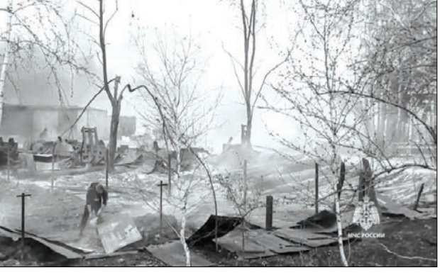
କିଛି ବର୍ଷ ଧରି ଗୁଜରାଟ ଜଙ୍ଗଲଗୁଡ଼ିକରେ ବଡ଼ ଧରଣର ନିଆଁ ଲାଗିବା ଘଟଣା ସାମନାକୁ ଆସିଯାଇଛି । ବିଶେଷତଃ ଗତ ଏହିପରି ଅସାମାନ୍ୟ ରୂପେ ଶୁଷ୍କ ଗ୍ରୀଷ୍ମକାଳ ଏବଂ ବହୁଥିବା ଚାପମାଡ଼କୁ ଦାୟୀ କରିଛନ୍ତି । ଗୁଜରାଟର କାଳିଙ୍ଗ ଦାଢ଼ି କରିଛନ୍ତି ଯେ ବର୍ତ୍ତମାନରେ ବିଶେଷତଃ ଆଉ କୌଣସି ଭୟ ନାହିଁ । କେବଳ ସ୍ଥାନୀୟ ମିଡ଼ିଆର ବିପୋର୍ତ୍ତ ଅନୁସାରେ ଜଙ୍ଗଲ ଏବେ ବି ଜଳୁଛି ।

ନୂଆଦିଲ୍ଲୀ: ଗୁଜରାଟର ଜଙ୍ଗଲରେ ଲାଗିଥିବା ନିଆଁରେ ବର୍ତ୍ତମାନ ସୁଦ୍ଧା ୨୧ ଜଣଙ୍କ ମୃତ୍ୟୁ ହୋଇଛି । କୁରଗନ ଏବଂ ସାଲବେରୀ ଆଞ୍ଚଳିକ ଜଙ୍ଗଲରେ ଗତ ଏକ ସପ୍ତାହ ଧରି ଲାଗିଥିବା ନିଆଁ ଲାଗିଛି । ନିଆଁ ଯୋଗୁଁ ବର୍ତ୍ତମାନ ସୁଦ୍ଧା ୫ ହଜାରରୁ ଅଧିକ ଘର ଜଳି ପାଉଁଶ ହୋଇଯାଇଛି । ଗୁଜରାଟର ନ୍ୟୁକ୍ଲିୟର ପାଟଳିପାଟଣାରେ ଜଙ୍ଗଲରେ ବ୍ୟକ୍ତି ନିଆଁ ଲାଗିବା ବେଳେ ଜଳି ପ୍ରାଣ ହରାଇଛନ୍ତି । ସ୍ଥାନୀୟ ଅଧିକାରୀ କହିଛନ୍ତି ଯେ ଜଙ୍ଗଲ ନିଆଁ ଯୋଗୁଁ କୁରଗନ ପ୍ରାନ୍ତର ସୁନ୍ଦର ଗାଁରେ ସବୁଠୁ ଅଧିକ ମୃତ୍ୟୁ ହୋଇଛି । ଏହା ସ୍ଥାନୀୟ ପର୍ଯ୍ୟଟକ ଶୁଖିଳା ଏବଂ ସାଲବେରୀଆ ନିକଟରେ ରହିଛି । ଜଙ୍ଗଲ ନିଆଁ ଯୋଗୁଁ ମୃତ୍ୟୁ ସଂଖ୍ୟା ଆହୁରି ବଢ଼ିପାରେ ବୋଲି ଆଶଂକା କରାଯାଇଛି । ଗତ