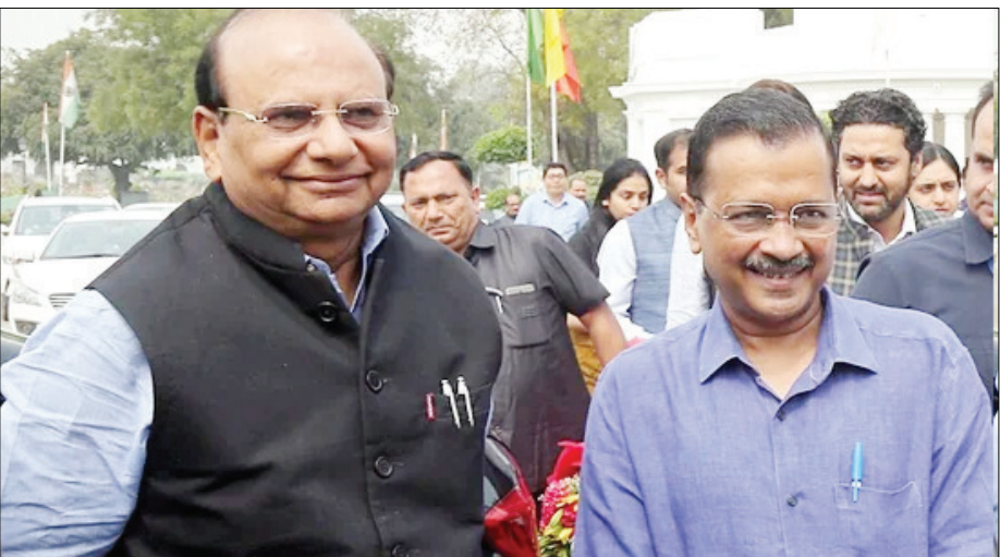
ରହିବ ବୋଲି କହିଛନ୍ତି। ଖଣ୍ଡପୀଠ କହିଛନ୍ତି, ସମସ୍ତ ପ୍ରକାରର ସେବା ଉପରେ ଦିଲ୍ଲୀ ସରକାରଙ୍କ ନିୟନ୍ତ୍ରଣ ରହିବ ଓ ଏହାର ନିଷ୍ପତ୍ତି ଉପ

ନୂଆଦିଲ୍ଲୀ: କେନ୍ଦ୍ର ଓ ଦିଲ୍ଲୀ ସରକାର ମଧ୍ୟରେ ଚାଲିଥିବା କ୍ଷମତା ଯୁଦ୍ଧରେ ବଡ଼ ରାୟ ଦେଇଛନ୍ତି ସୁପ୍ରିମକୋର୍ଟ। କ୍ଷମତା ଯୁଦ୍ଧରେ ଦିଲ୍ଲୀ ସରକାରଙ୍କର ହେଉଛି ବଡ଼ ବିଜୟ। କେନ୍ଦ୍ର ସରକାରଙ୍କ ଦେଇ ହେଲେ ରାଜ୍ୟର ଶାସନ ଅଧିକାର ହତ୍ୟା କରିପାରିବେ ନାହିଁ। ପ୍ରକୃତ କ୍ଷମତା ନିର୍ବାଚିତ ସରକାରଙ୍କ ପାଖରେ ରହିବ। ଗଣତାନ୍ତ୍ରିକ ଉପାୟରେ ଗଠନ ହୋଇଥିବା ସରକାର ପାଖରେ ପ୍ରକୃତ ପ୍ରଶାସନିକ କ୍ଷମତା ରହିବ। କେନ୍ଦ୍ର କେବଳ ଜମି, ଆଇନ ଶୁଖିଲା ଓ ପୁଲିସ୍ ଉପରେ ନିଜର ନିୟନ୍ତ୍ରଣ ରଖିପାରିବେ ବୋଲି ଆଜି ସର୍ବୋଚ୍ଚ ଅଦାଲତ କହିଛନ୍ତି। ସୁପ୍ରିମକୋର୍ଟର ପ୍ରଧାନ ବିଚାରପତି ଜଷ୍ଟିସ୍ ଡିଓଲ୍ଲୀ ଚନ୍ଦ୍ରଚୂଡ଼ଙ୍କୁ ନେଇ ଗଠିତ ୫ ଜଣିଆ ଖଣ୍ଡପୀଠ ସର୍ବସମ୍ମତରେ ଦିଲ୍ଲୀର ପ୍ରଶାସନିକ କ୍ଷମତା ନିର୍ବାଚିତ ସରକାରଙ୍କ ହାତରେ