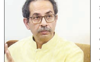
ସର୍ବୋଚ୍ଚ ଅଦାଲତ ଅଗ୍ରହଣ କରି ଦେଇଛନ୍ତି। ଉତ୍ତର ଠାକୁରାଣୀ ଆଗୁଆ ଇସ୍ତଫା ଦେଇଥିଲେ। ତେଣୁ ଏପରି ସ୍ଥିତିରେ ସର୍ବୋଚ୍ଚ ଅଦାଲତ କିଛି କରିପାରିବେ ନାହିଁ ବୋଲି କହିଛନ୍ତି। ଶୁଣାଣି ଦେଇ ସର୍ବୋଚ୍ଚ ଅଦାଲତ ତତ୍କାଳୀନ ମହାରାଷ୍ଟ୍ର ରାଜ୍ୟପାଳ ଉତ୍ତର ସିଂହ କୋଷ୍ଠାୟୋଙ୍କୁ ଆଭିଯୁକ୍ତ ଉପରେ ମଧ୍ୟ ପ୍ରଶ୍ନ ଉଠାଇଛନ୍ତି। ତାଙ୍କର ତୃତୀୟ ନିଷ୍ପତ୍ତି ସିଂହେ ଗୋଷ୍ଠୀକୁ ହୁହୁଥିଲା। ଉତ୍ତର ଠାକୁରାଣୀ ସରକାର ଗଠନ ପାଇଁ ଆବେଦନ କରିବା ପାଇଁ ହେଉଥିବା ଆବେଦନକୁ ମଧ୍ୟ

ପୁଲ୍ଲାଇ: ରାଜ୍ୟପାଳଙ୍କ ତୃତୀୟ ଯୋଗୁ ବିଜେପି ସହ ମିଶି ସରକାର ଗଠନ କରିଥିବା ଏକନଥ ସିଂହେ ପୂର୍ବ ପରି ଶାସନ ଗାଦିରେ ରହିବେ ବୋଲି ସୁପ୍ରିମକୋର୍ଟ କହିଛନ୍ତି। ମହାରାଷ୍ଟ୍ର ମୁଖ୍ୟମନ୍ତ୍ରୀ ପଦକୁ ଉତ୍ତର ଠାକୁରାଣୀ ନିଜ ଆଜୁ ଇସ୍ତଫା ଦେଇଥିବାରୁ ତାଙ୍କୁ ଆଉ ପୁନଃ ଅଧିକାର କରିବା ପାଇଁ ନାହିଁ। ଯଦି ସେ ଇସ୍ତଫା ନ ଦେଇ ଆସନ୍ତେ, ତାହେଲେ ଆଉ କିଛି ଘଟଣାଆଦା ବୋଲି ସର୍ବୋଚ୍ଚ ଅଦାଲତ କହିଛନ୍ତି। ଗତବର୍ଷ ଜୁନ ମାସରେ ତତ୍କାଳୀନ ମୁଖ୍ୟମନ୍ତ୍ରୀ ଉତ୍ତର ଠାକୁରାଣୀ ବିରୋଧରେ ବିପ୍ରୋଧ କରିଥିବା ଏକନଥ ସିଂହେ ଓ ଅନ୍ୟ ୧୫ ଜଣ ବିଧାୟକଙ୍କୁ ସୁପ୍ରିମକୋର୍ଟ ଅପରାଧ କରିପାରିବେ ନାହିଁ ବୋଲି କହିଛନ୍ତି। ଏହା ଉପରେ ବୃହତ୍ ସାମ୍ବିଧାନିକ ଦେଖି ନିଷ୍ପତ୍ତି ନଦେବା ସହ ଅପରାଧ କରିବାର କ୍ଷମତା ବାତସ୍ତବିକ ହାତରେ ରହିବ। ଠାକୁରାଣୀ ସରକାରଙ୍କୁ ପୁନଃ ଅଧିକାର କରିବା ପାଇଁ ହେଉଥିବା ଆବେଦନକୁ ମଧ୍ୟ