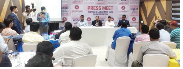
ମଧ୍ୟରେ ସଂପୂର୍ଣ୍ଣ ସୁନ୍ଦର ଅବଲମ୍ବନ କରିବା ସହ ଗ୍ରହଣ ସେବାର ଆତ୍ମାୟତାର ଭାବକୁ ଆହାର କରି ଅରୁନ୍ଧତୀ ଆଜି ଡିଡିଏର ଜନମାନସଙ୍କ ହୃଦୟରେ ଏକ ସ୍ୱତନ୍ତ୍ର ସ୍ଥାନ ନେଇପାରିଛି। ଅରୁନ୍ଧତୀ ନୂତନ ଅତ୍ୟାଧୁନିକ ପ୍ଲାଗସିପ୍ ସୋରୁମ୍ ୫୦୦୦ ବର୍ଷପୂର୍ବ ପରିମିତ ଏବଂ ଏହା ମଧ୍ୟରେ ସର୍ବୋଚ୍ଚ ଡିଡିଏଲ୍ ଓ ସଂପୂର୍ଣ୍ଣ ହଳମାଳି HUID ସୁନ୍ଦରତାକୁ ୫୦୦୦ରୁ ଉର୍ଦ୍ଧ୍ୱ ସୁନା ଗହଣା ଡିଜାଇନ, ହାରା ଗହଣା, ସୁତନ୍ତ ଭାବେ ପ୍ରସ୍ତୁତ ଚୁକ୍ତା ଗହଣା ଓ କଳାକୃତି ସମାର ଗହଣା ସହ ଅରୁନ୍ଧତୀର ୫ ଭାଗ ପ୍ରମିଳ ସେବା ପାଇପାରିବେ ଏହି ନୂତନ ସୋରୁମ୍ ଶୁଭାରମ୍ଭ ଅବସରରେ ଅରୁନ୍ଧତୀ କ୍ଲେଉର୍ସ ଚଳଚ୍ଚିତ୍ର ଅର୍ଦ୍ଧଶତାବ୍ଦୀ ଅପର HUID ହଳମାଳି ସୁନା ଗହଣା ଗଜା ମଜୁରୀ ଉପରେ ଚ.୩୫୦୦/- ପର୍ଯ୍ୟନ୍ତ

ରାବନୀପାଟଣା (ଭାସ୍କର ନ୍ୟୁଜ୍): ଡିଡିଏଲ୍ ସର୍ବ ବୃହତ୍ କୁଳାଳୀ ବ୍ରାଣ୍ଡ ଅରୁନ୍ଧତୀ କ୍ଲେଉର୍ସ ଚଳଚ୍ଚିତ୍ର ଚଳେ ମାସ ୧୨ ତାରିଖ ଶୁକ୍ରବାର ପୂର୍ବରୁ ଘ. ୧୦.୦୦ ଠାରୁ ଭାବନୀପାଟଣା ଠାରେ ତା’ ନୂତନ ଅତ୍ୟାଧୁନିକ ପ୍ଲାଗସିପ୍ ଗହଣା ସୋରୁମ୍ ଶୁଭାରମ୍ଭ କରିବାକୁ ଯାଉଅଛି। ଅଜି ଏକ ପ୍ରେସ୍ ବାର୍ତ୍ତାରେ ଅରୁନ୍ଧତୀ କ୍ଲେଉର୍ସ ପରିଚୟ ନିର୍ଦ୍ଦେଶକ ସୁବ୍ରତ୍ ସମେତେ ଏହି ସୁତରା ଦେବା ସହ ପ୍ରକାଶ କରିଛନ୍ତି ଯେ ସମସ୍ତଙ୍କର ସ୍ନେହ, ଶ୍ରଦ୍ଧା, ଆଶୀର୍ବାଦ ଓ ଅରୁନ୍ଧତୀ ଉପରେ ଥିବା ପ୍ରକାଶକର୍ତ୍ତବ୍ୟକୁ ପାଠ୍ୟ କରି ଅରୁନ୍ଧତୀ ଆଜି ସାରା ଡିଡିଏ ସହ ପୂର୍ବଭାଗରେ ଏକ ପ୍ରତିଷ୍ଠିତ ପ୍ରଶ୍ନା ସୁନା ଗହଣା ବ୍ରାଣ୍ଡ ଭାବରେ ମାନ୍ୟତା ପାଇପାରିଛି। ଗତ ୨୩ବର୍ଷ ଧରି ସୁନା ଗହଣା ମାନରେ ସୁନ୍ଦର, କାଳକାର୍ଯ୍ୟତା, ସଠିକ୍ ବ୍ୟବହାର ପଦସ୍ତପ ଓ ତା