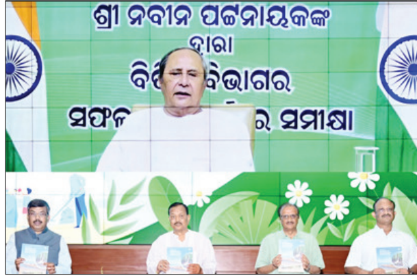
କର୍ମକ୍ରମରେ ମୁଖ୍ୟମନ୍ତ୍ରୀ ନବୀନ ପଟ୍ଟନାୟକଙ୍କୁ ସମ୍ମାନିତ କରିବା ପାଇଁ କାର୍ଯ୍ୟକ୍ରମରେ ଅତିଥି ଭାବେ ଯୋଗଦେଇଥିଲେ।

ଭୁବନେଶ୍ୱର (ଭାରତ ନ୍ୟୁଜ୍): ଲୋକସେବା ଭବନରେ ଆୟୋଜିତ ରାଜ୍ୟସ୍ତରୀୟ ବିଶ୍ୱ ପରିବେଶ ଦିବସ-୨୦୨୩ କାର୍ଯ୍ୟକ୍ରମର ମୁଖ୍ୟ ଅତିଥି ମାନ୍ୟବର ମୁଖ୍ୟମନ୍ତ୍ରୀ ନବୀନ ପଟ୍ଟନାୟକ ଭିତ୍ତିରେ ବାର୍ତ୍ତା ମାଧ୍ୟମରେ କହିଛନ୍ତି ଯେ ‘ବିନ୍, ପ୍ଲ୍ୟୁଷ୍ଟ୍, ପଲ୍ୟୁସ୍ଡ’, ଅଭିଯାନ ଅଧୀନରେ ଏ ବର୍ଷର ବିଷୟବସ୍ତୁ ହେଉଛି ‘ପ୍ଲ୍ୟୁଷ୍ଟ୍ ପ୍ରଦୂଷଣର ସମାଧାନ’। ପରିବେଶ ସଂପର୍କିତ ସମସ୍ୟାର ମୁକାବିଲା ପାଇଁ କାର୍ଯ୍ୟ କରିବା ଆଜି ସମୟର ଆହ୍ୱାନ। ଆମର ଦୈନନ୍ଦିନ କାର୍ଯ୍ୟକ୍ରମରେ ପରିବର୍ତ୍ତନ ଆଣି ପ୍ଲ୍ୟୁଷ୍ଟ୍ ପ୍ରଦୂଷଣର ପ୍ରଭାବ ହ୍ରାସ କରିବା ପାଇଁ ଏ ବର୍ଷର ବିଷୟବସ୍ତୁ ଆମ ସମସ୍ତଙ୍କ ଆହ୍ୱାନ