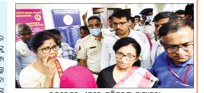
ଭୁବନେଶ୍ୱର ଏମ୍‌ସିରେ ପଶିମବଙ୍ଗ ସ୍ୱାସ୍ଥ୍ୟମନ୍ତ୍ରୀ

ଚିକିତ୍ସିତ ହେଉଥିବା ଲୋକଙ୍କ ମଙ୍ଗଳକାନ୍ତ ଭୁବନେଶ୍ୱର ସଂସଦ ଅପରାଜିତା ଖଡ଼୍‌ଜା ଭେଟିଛନ୍ତି। ସେ ଆହତଙ୍କୁ ଭେଟି ସ୍ୱାସ୍ଥ୍ୟବସ୍ଥା ପଚାରି ଦୁଃଖିତ ସହ ଆଶୁ ଆରୋଗ୍ୟ କାମନା କରିଛନ୍ତି। ଏହା ସହ ଆହତଙ୍କ ଚିକିତ୍ସା ବ୍ୟବସ୍ଥା ସମ୍ପର୍କରେ ମେଡିକାଲ କର୍ତ୍ତୃପକ୍ଷଙ୍କ ସହ ଆଲୋଚନା କରିଥିଲେ। ଏସପିରେ ଆହତଙ୍କୁ ଭେଟିବା ପରେ ସେ କହିଛନ୍ତି ଯେ ଆହତମାନଙ୍କୁ ଭଲ ଚିକିତ୍ସା ଯୋଗାଇ ଦିଆଯାଇଛି। ଏସପିରେ ସବୁ ବିଭାଗରେ ତାତ୍କାଳିନୀ ଅକ୍ସିଜେନ ପରିଷ୍ଠାପ କରୁଛନ୍ତି। ସବୁ ଆହତ ଧାରଣ ଧାରଣ ହେଉଛନ୍ତି। ଅପରପକ୍ଷରେ ଏବେ ରାଜନୀତି କରିବାର ସମୟ ନୁହେଁ। ଉଦ୍ଧାର କେନ୍ଦ୍ର ଓ ରାଜ୍ୟ ସରକାରଙ୍କ ସମ୍ପର୍କରେ ଆହତମାନଙ୍କୁ ସମସ୍ତ ଚିକିତ୍ସା ଯୋଗାଇ ଦିଆଯାଇଛି ବୋଲି କହିଛନ୍ତି ସଂସଦ ଅପରାଜିତା ଖଡ଼୍‌ଜା।