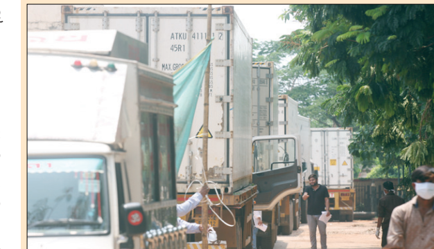
ଭୁବନେଶ୍ୱର(ଭାସ୍କର ନ୍ୟୁଜ୍): ବାହାନଗା ରେଳ ଦୁର୍ଘଟଣାରେ ପ୍ରାଣ ହରାଇଥିବା ୨୭୫ ଜଣଙ୍କ ମଧ୍ୟରୁ ୧୨୩

ସେମାନଙ୍କ ସମ୍ପର୍କୀୟଙ୍କୁ ହସ୍ତାନ୍ତର କରାଯାଇଛି। ବାକି ୫୭ଟି ମୃତଦେହ ମଧ୍ୟରୁ ୪୧ ଟିକୁ ୨ ଟି କଣ୍ଠେନର ମଧ୍ୟରେ ସଂରକ୍ଷିତ କରି ରଖାଯାଇଛି ବୋଲି ଏମ୍‌ସି ପକ୍ଷରୁ ସୂଚନା ଦିଆଯାଇଛି। ସୁନାମାୟୋଗ ଯେ, ଏମ୍‌ସି ପକ୍ଷରୁ ଏତେ ସଂଖ୍ୟାରେ ମୃତଦେହ ସଂରକ୍ଷଣ ପାଇଁ ଡିଏ ଫୁଲ ନିୟମାବଳୀ ପାରାଫିପରୁ ୫ ଟି କଣ୍ଠେନର ମରାଯାଇଥିଲା। ପ୍ରତି କଣ୍ଠେନରେ ୩୦ରୁ ୪୦ ମୃତଦେହ ସଂରକ୍ଷିତ ରହିପାରିବ। କଣ୍ଠେନରେ ଦୁର୍ଘଟଣା ପର୍ଯ୍ୟନ୍ତ ମୃତଦେହ ସଂରକ୍ଷିତ ରଖାଯାଇପାରିବ।