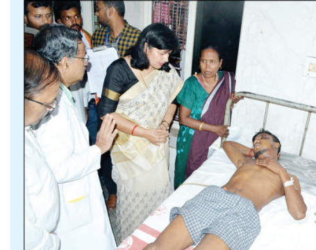
କଟକ(ଭାସ୍କର ନ୍ୟୁଜ୍): ବାଲେଶ୍ୱର ଜିଲ୍ଲା ବାହାନଗା ଟ୍ରେନ୍ ଦୁର୍ଘଟଣାରେ ଆହତ ହୋଇ କଟକ ଏସପି ମେଡିକାଲରେ

ଚିକିତ୍ସିତ ହେଉଥିବା ଲୋକଙ୍କ ମଙ୍ଗଳକାନ୍ତ ଭୁବନେଶ୍ୱର ସଂସଦ ଅପରାଜିତା ଖଡ଼୍‌ଜା ଭେଟିଛନ୍ତି। ସେ ଆହତଙ୍କୁ ଭେଟି ସ୍ୱାସ୍ଥ୍ୟବସ୍ଥା ପଚାରି ଦୁଃଖିତ ସହ ଆଶୁ ଆରୋଗ୍ୟ କାମନା କରିଛନ୍ତି। ଏହା ସହ ଆହତଙ୍କ ଚିକିତ୍ସା ବ୍ୟବସ୍ଥା ସମ୍ପର୍କରେ ମେଡିକାଲ କର୍ତ୍ତୃପକ୍ଷଙ୍କ ସହ ଆଲୋଚନା କରିଥିଲେ। ଏସପିରେ ଆହତଙ୍କୁ ଭେଟିବା ପରେ ସେ କହିଛନ୍ତି ଯେ ଆହତମାନଙ୍କୁ ଭଲ ଚିକିତ୍ସା ଯୋଗାଇ ଦିଆଯାଇଛି। ଏସପିରେ ସବୁ ବିଭାଗରେ ତାତ୍କାଳିନୀ ଅକ୍ସିଜେନ ପରିଷ୍ଠାପ କରୁଛନ୍ତି। ସବୁ ଆହତ ଧାରଣ ଧାରଣ ହେଉଛନ୍ତି। ଅପରପକ୍ଷରେ ଏବେ ରାଜନୀତି କରିବାର ସମୟ ନୁହେଁ। ଉଦ୍ଧାର କେନ୍ଦ୍ର ଓ ରାଜ୍ୟ ସରକାରଙ୍କ ସମ୍ପର୍କରେ ଆହତମାନଙ୍କୁ ସମସ୍ତ ଚିକିତ୍ସା ଯୋଗାଇ ଦିଆଯାଇଛି ବୋଲି କହିଛନ୍ତି ସଂସଦ ଅପରାଜିତା ଖଡ଼୍‌ଜା।